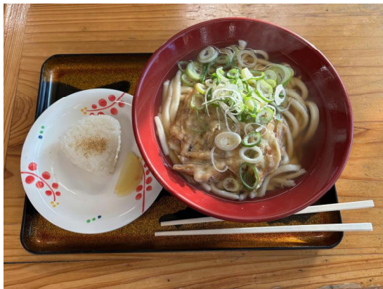
(大晦日の朝食 某うどん屋 20205.12.31)

振り返ってみると、20は成人式が市民会館で行われた。初めて背広上下を着た。30歳は、2つめの勤務先で5年目を迎え、仕事の面でもプライベートでも充実した日