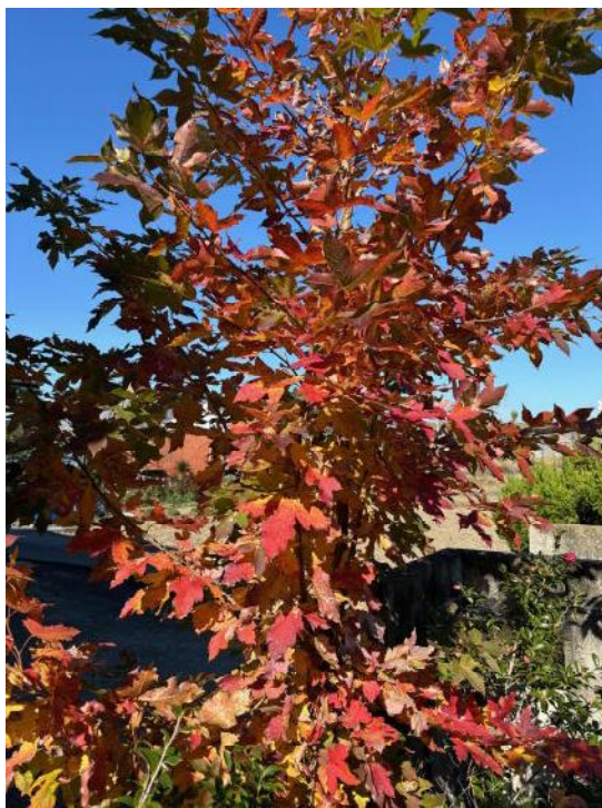
(モミジバフウ 自宅 2025.12.28)

退職後2年間は自宅のある市内で勤務した。その後は、自宅から85km離れた別の市で勤務している。63にして、新たな節目ができた。この節目はどのくらいの期間に？それは、きっと神ぞ知ること？