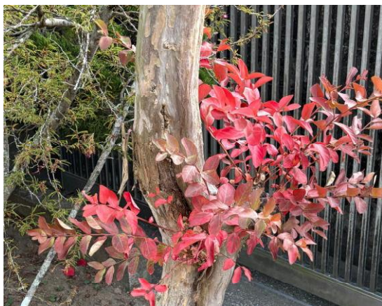
(サルスベリの紅葉 延岡市緑ヶ丘 2025.12.8)

「友達は、人生を豊かにしてくれるかけがえのない存在です。喜びや悲しみを分かち合ったり、何気ないおしゃべりで笑い合ったり、友達と過ごす時間は特別なものです。」(AI の回答)