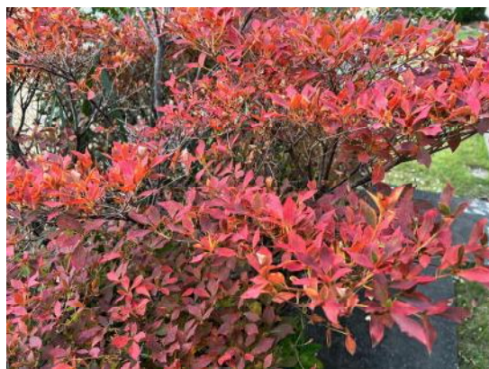
(ドウダンツツジ 自宅 2025.12.6)

ビートたけしさんの「友達」を読んで、はっとした。彼がどうしてそのような反応だったのか！彼の友達として足りなかったのは自分だったのだと……。