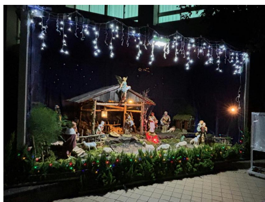
(馬小屋 延岡市緑ヶ丘 2025.12.3)

困った時、助けてくれたり 自分の事のように心配して 相談に乗ってくれる そんな友人がほしい 馬鹿野郎、 友達がほしかったら 困ったとき助けてやり 相談に乗り 心配してやる事だ そして相手に何も期待しない事 それが友人を作る秘訣だ (「友達」 ビートたけし)