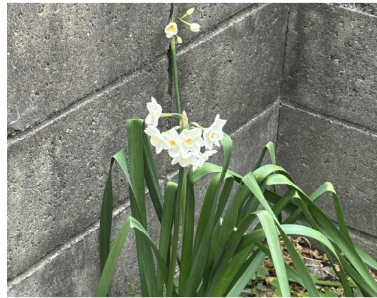
(隅で咲く水仙 延岡市緑ヶ丘 2025.3.14)

人の心は見えない。しかし、その表情や交わす言葉、その振る舞いなどによって、見え隠れするように思う。部分的には、見えてくる可能性があるように思う。