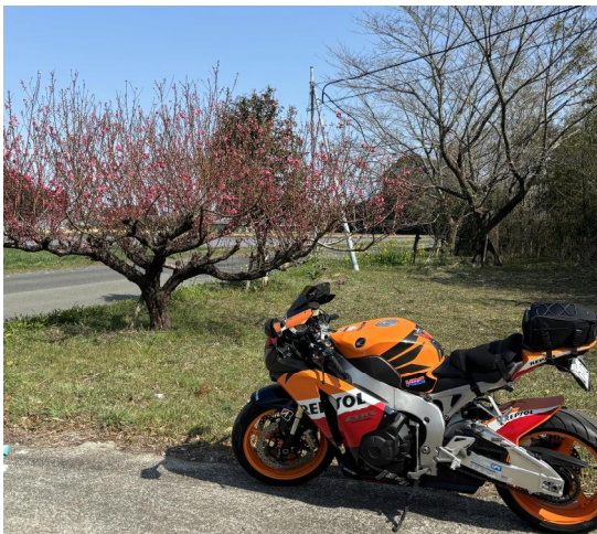
(梅と二輪 宮崎市細江 2025.3.9)

私の目は、確かに、開いていたのだけれど、開いていただけで、意識が別のところにあったのか?それとも何か気になることを考えていたのか?さっぱり、思い出せない、節穴だった私。