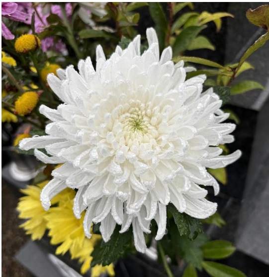
(雨の日の菊 宮崎市 2025.3.15)

何かの展示会に行ったとき、「あの作品って、さりげないけど心に残るよね!」と隣人に言われ、「そんな作品があったっけ?」と思った自分。見ているようで、見てなかったことにはっとする。