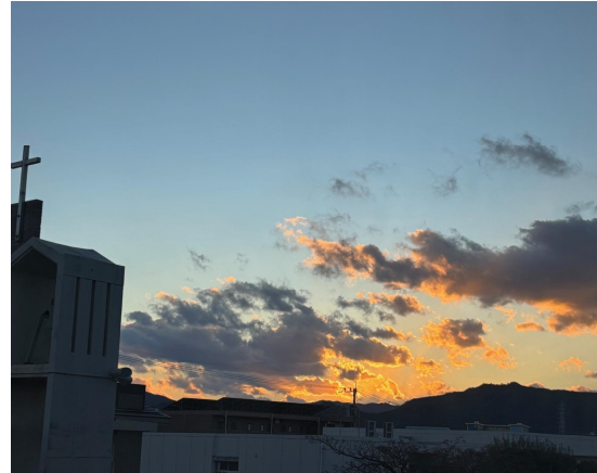
(夕焼け 延岡市緑ヶ丘 2025.2.4)

職業柄、朝声をかけることが多いのですが、何度声をかけても相手にしてくれない小学生が複数います。よほど変なおじさん(彼らから見たら、おじいさん?)とおもわれているのでしょうか。いつも一方的な挨拶で終わってしまいます。