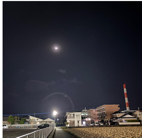
(夜の月 延岡市出北 2025.2.3 20:26)

もちろん職場内ではお互いに知っているのので、声をかけたら返事が返ってきます。思わずたくさん話すことができ、安らぎを覚えます。感謝したくなります。