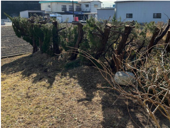
(伐採後のカイズカイブキ 自宅 2025.2.11)

②について、会合の誘いは誰もが経験していることでしょうし、管理職になれば、役職就任を依頼についての打診をしたこともあるでしょう。