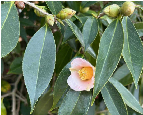
(ツバキ 延岡市緑ヶ丘3丁目 2024.12.20)

ときどき、自分の言った言葉が自分自身に返ってくることもある。それは、あんなこと言わなければよかった、という後悔の気持ち。そんなつもりはなかったのに、言葉のついでに出てしまった。それがやけに気になってしまった。