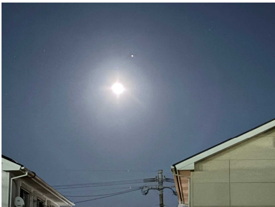
(月と火星 延岡市別府町 2024.12.18)

自分の思うとおりにできないことが生じたときに、陥りやすいのは、相手を変えようとする。そんな方は、結構いらっしゃるように思う。