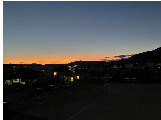
(夕焼け 延岡市緑ヶ丘3丁目 2024.12.16)

このように、文句を言っている人にとっては、大きな問題でしょう。ですが、仲間や上司はどう思っているのでしょうか？